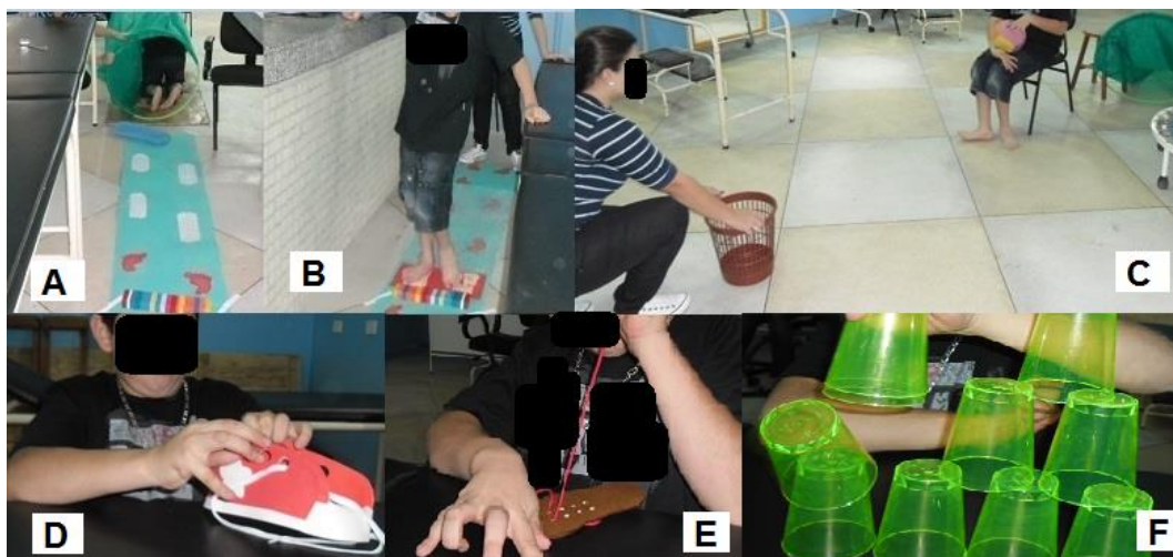
Figura 2. Exemplos de atividades do programa de intervenção da criança 2.

A- Tapete sensorial com obstáculos e túnel para atividades de coordenação e equilíbrio, e organização espacial; B-Atividade de coordenação e noção espacial dentro do túnel; C- Atividade de amarelinha para treino de coordenação e equilíbrio em apoio bipodal; D- Atividade de amarelinha para treino de coordenação e equilíbrio em apoio unipodal para treino de equilíbrio; E- atividade de motricidade fina com torre de copos (empilhar); F/G- atividade de motricidade fina com cartas (empilhar).