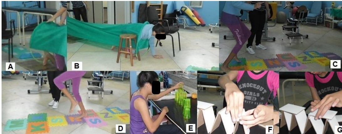
Figura 1. Exemplos de atividades do programa de intervenção da criança 1.

A- Tapete sensorial com obstáculos e túnel para atividades de coordenação e equilíbrio, e organização espacial; B-Atividade de coordenação e noção espacial dentro do túnel; C- Atividade de amarelinha para treino de coordenação e equilíbrio em apoio bipodal; D- Atividade de amarelinha para treino de coordenação e equilíbrio em apoio unipodal para treino de equilíbrio; E- atividade de motricidade fina com torre de copos (empilhar); F/G- atividade de motricidade fina com cartas (empilhar).