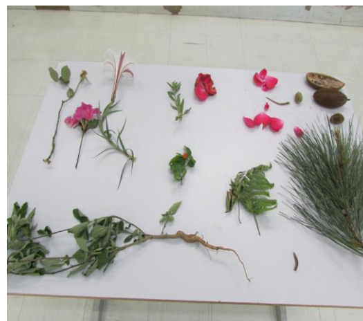
Figura 1 – Amostras biológicas das plantas que compõe o filo das Angiospermas e suas partes.

Os materiais biológicos, livros didáticos e paradidáticos, imagens detalhadas, definições técnicas e desenhos foram apresentados e deram a oportunidade de ampliar a visão dos surdos sobre os termos vistos. Assim como demonstram as Figuras 1 e 2.