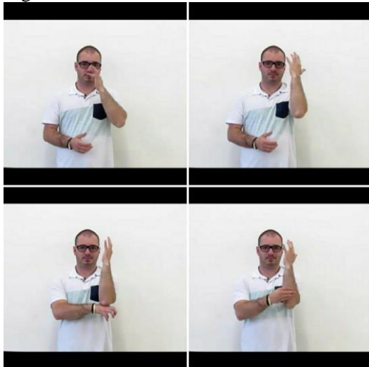
Figura 3 – Posicionamento de mãos que demonstra a flor, as raízes e o caule, como partes de uma planta pertencente ao filo das Angiospermas.

E como exemplo das filmagens realizadas segue abaixo uma sequência de imagens que representam o sinal correspondente a palavra Angiosperma. Figuras 3 e 4.