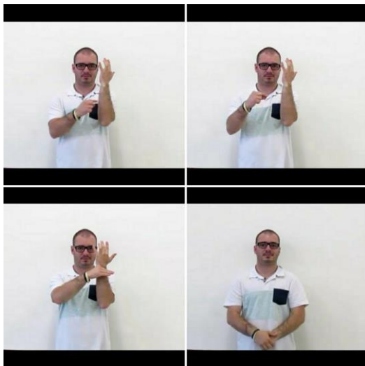
Figura 4 – posicionamento de mãos que mostra a folha, as pétalas e sépalas como partes da flor.

Após esta última etapa desta fase, iniciou-se a segunda fase do trabalho, onde se executaram as edições dos vídeos. Cada