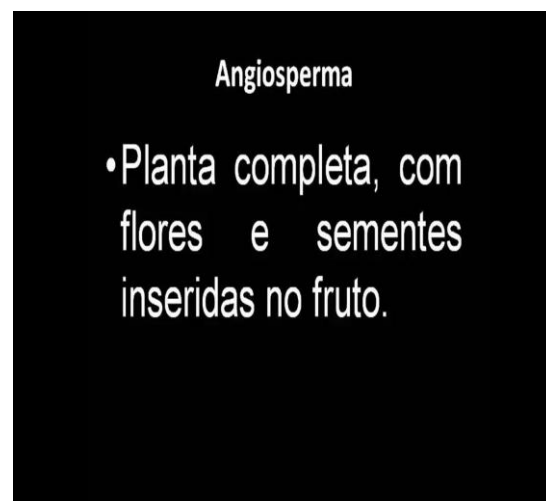
Figura 6 – Definição de Angiosperma.

Alguns vídeos precisaram ser regravados em alguns momentos, pois apresentavam erros na execução dos sinais e/ou possuíam baixa qualidade em sua resolução. Ao fim do trabalho, os vídeos