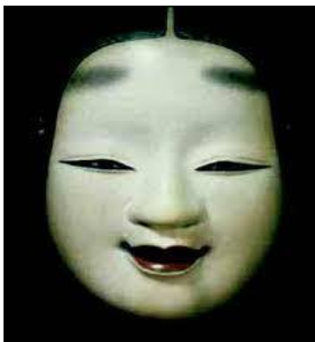
Figura 04