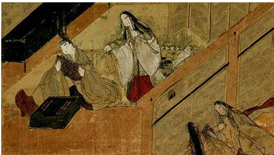
Figura 02 - Névoa Noturna , de Genji Monogatari (Museu de Tokugawa).

A perspectiva pela qual olhamos o quarto é a mesma usada no ukiyo-e :