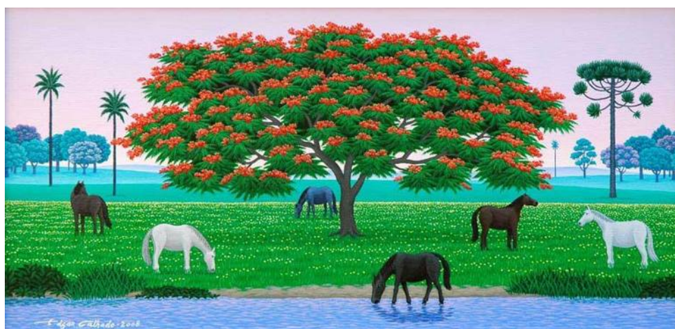
Flamboyant , de Edgar Calhado.

A forte influência da forma singular e do estilo ilustrativo utilizado nas obras de Henri Rousseau (já abordado nesse estudo), com característica não convencional, contribuem para o advento da Pop-art e da Op-art , pela utilização de magnífico colorido e formas simplificadas, e exemplificam a diferenciação entre as manifestações artísticas citadas neste parágrafo.