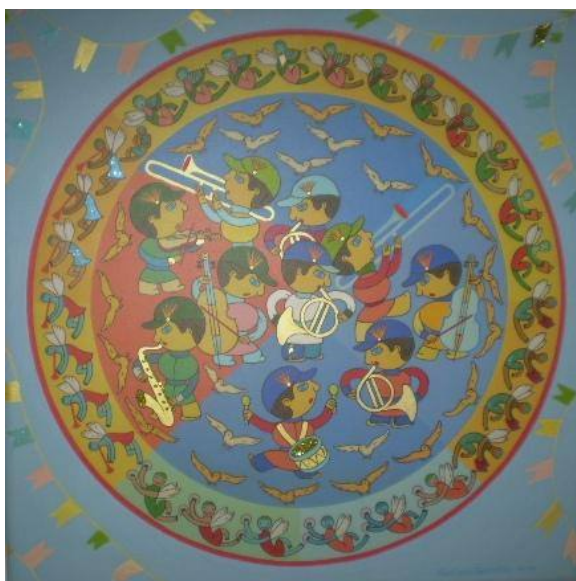
Ciranda da banda , de Corina Ferraz.

A análise da composição da tela Ciranda da banda direciona o espectador à indicação da dicotomia nela presente, quando figuras em "ciranda" procuram mostrar a fraternidade entre as pessoas retratadas, envolvidas numa atividade da execução melódica, mas que, pelas expressões