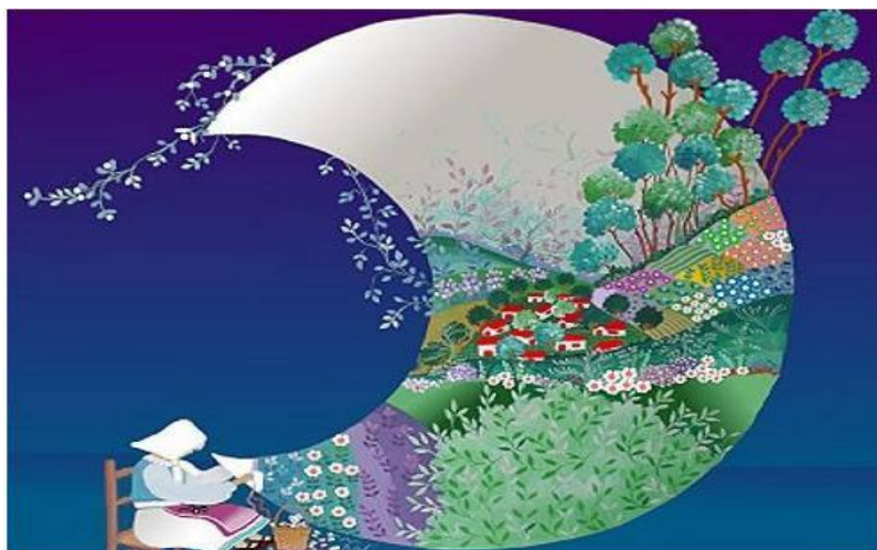
Bordando , de Pilar Sala. Imagem disponível em: http://blogillustratus.blogspot.com.br/2009/12/arte-naif.html